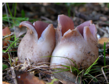
Sarcosphaera crassa , incluida entre las 33 especies propuestas por el ECCF en el 2001 para la lista roja europea.

listas que incluían especies más o menos conocidas, como la Battarrea phalloides y Phellorinia herculanea , especies presentes en nuestras estepas de la depresión del Ebro o el Boletus regius , localmente abundante en nuestro querido Moncayo. Actualmente existe un grupo de trabajo a nivel europeo, el ECCF (European Council for Conservation of Fungi), que ya en 1991 propuso una lista de 10 especies a proteger. Posteriormente, en el año 2001 se concluyó un informe, publicado en el año 2003, en el que se ampliaba el número de especies prioritarias en Europa a 33, se propone su inclusión en el Apéndice I de la Convención de Berna y en él se citan especies bastante conocidas en nuestra región, como Sarcosphaera crassa ( S.coronaria ) o Gomphus clavatus . Actualmente el grupo de trabajo del ECCF en España y Portugal trabaja en la propuesta de una lista roja de 50 especies para la Península Ibérica.