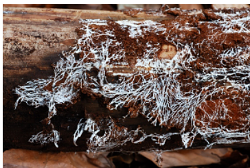
Detalle de un micelio bajo la corteza de un árbol muerto.

Ante todos estos problemas surge la Biología de la Conservación como una ciencia multidisciplinar, bien para dar una solución definitiva a esta situación, o para minimizar su impacto y corregir sus consecuencias si la situación es difícilmente reversible, manteniendo siempre como objetivo la viabilidad de todas las especies y la compatibilidad con la actividad humana. Ese objetivo común de viabilidad nos obliga a no poder pensar en los hongos como elemento único, sino integrados en un conjunto de seres vivos relacionados entre si, a veces más de lo que pensamos. Nuestra pasión por ellos se convierte a veces en obsesión por resolver las dudas taxonómicas de un reino tan extenso, nos lleva a veces a estudiarlos sin contemplar lo que les rodea, fuera de contexto. Incluso la metodología de análisis de las necesidades de conservación puede no ser la misma para una misma especie en diferente ambiente y con toda seguridad no podrá ser única para todas ellas.