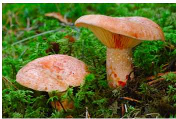
Lactarius deliciosus , rebollón. La especie más recolectada en Aragón.

Uno de los supuestos problemas particulares en la conservación de los hongos es el efecto negativo que puede tener la recolección en las especies comestibles, tanto comercial como para autoconsumo, que ha llegado convertirse en una autentica moda o fenómeno social. El mundo rural necesita aprovechar todos los recursos que se encuentran a su alcance, la recolección comercial de las setas como el fomento del micoturismo y/o turismo de naturaleza, puede y debe ser un complemento económico para el crecimiento de muchas comarcas rurales, pero lógicamente es necesario tener controlado su posible impacto y asegurar su continuidad.