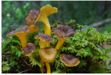
Craterellus lutescens , especie susceptible de alteración del hábitat por su recolección.

mencionar la compactación del suelo que se puede producir en zonas muy transitadas, aparición de auténticos senderos que antaño no estaban, siempre que se buscan setas suele haber gran humedad en el suelo, lo que favorece su apelmazamiento y que puede afectar a especies como la trompeta amarilla ( Craterellus lutescens , Cantharellus lutescens ), que necesita zonas de pinar umbrías con musgo esponjoso para vivir.