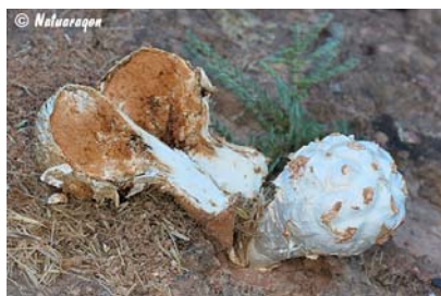
Phellorinia herculanea , especie presente en nuestras estepas de la depresión del Ebro.

Aparte de esta separación de los hongos por su forma de vida, micorrizógenos, saprófitos y parásitos, de cara a elaborar metodologías para evaluar las posibles necesidades de conservación ya podemos vislumbrar dos grandes grupos bien diferenciados pero que sin duda requerirán nuevas divisiones a partir de éstas, hongos ubicuistas, que permanecen grandes periodos de tiempo asociados a árboles o plantas o en un sustrato que tardan bastante tiempo en consumir, como podrían ser los lignícolas instalados en troncos o tocones de madera y por otra parte hongos oportunistas, principalmente los que viven de sustratos efímeros y que su ciclo ha de ser rápido, como los fimícolas, adaptados a la temporalidad de los excrementos animales. La metodología de seguimiento de su evolución no va a poder ser la misma en ambos grupos.